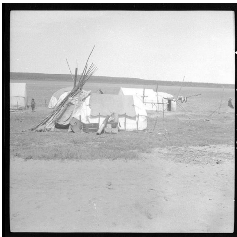
Tentes indiennes à Rupert's House, 1945. Archives nationales à Québec, fonds Ministère de la Culture et des Communications (E6, S7, S51, P27917). Photographe : Pierre Dagenais.

MUNICIPALITÉ DE VILLAGE CRI – WASKAGANISH